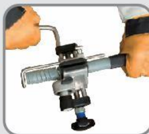
Îndepărtare izolație PVC