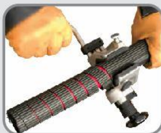
Îndepărtarea iutei exterioară